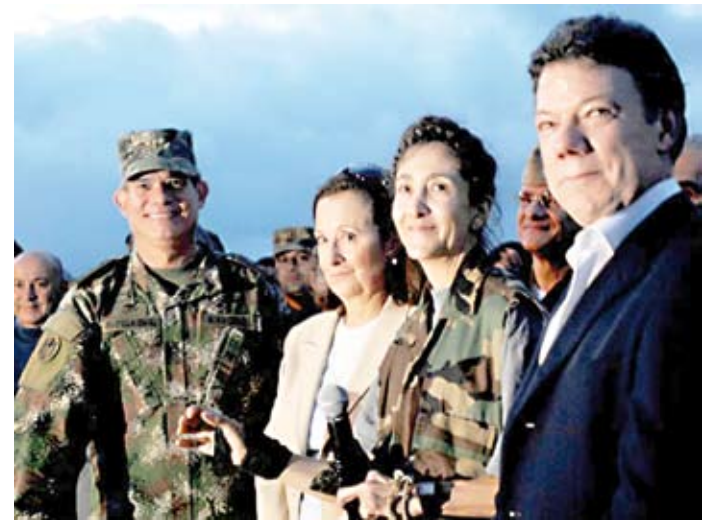
CATAM, DOS DE JULIO DE 2008

La Operación Jaque fue calificada por la comunidad internacional como impecable, sin antecedentes en la historia, única en su clase. Como producto del talante y el esfuerzo humano hay que reconocer que, en medio del éxito rotundo, hubo errores, entre los que quisiera mencionar el más significativo de ellos: el ego. Nuestro ego pudo más que el sentido de la prudencia y la seguridad. Cada quien fue dando a conocer fragmentos de la operación que resaltaban su participación. Fueron tantos los medios de comunicación del mundo y nacionales que entrevistaron por horas a quienes se identificaron como protagonistas, que al final se dieron a conocer aspectos que a mi juicio hubie-