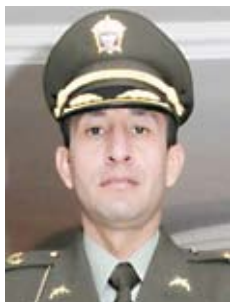
Mayor Vianey Javier Rodríguez Porras