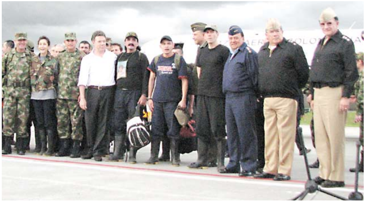
CATAM, DOS DE JULIO DE 2008

Sin embargo, los verdaderos protagonistas de la Operación Jaque son los colombianos de bien, que vibraron de alegría e inmenso orgullo al compartir con sus Fuerzas Militares la más importante gesta heroica de la historia reciente de la