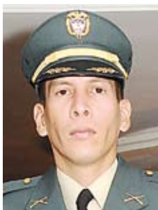
Mayor Juan Carlos Bermeo Cobaleda

El comandante general de las Fuerzas Militares, general Freddy Padilla de León, y su Estado Mayor ofrecieron un almuerzo a los militares y policías rescatados, el dos de julio de 2008, durante la histórica Operación Jaque. Los homenajeados asistieron al Club Militar en compañía de sus padres, esposas e hijos.