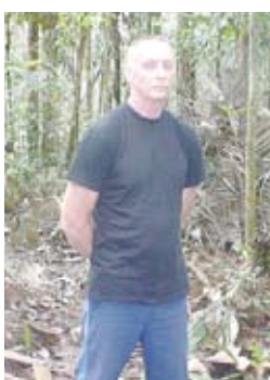
THOMAS HOWES Piloto estadounidense

El dos de julio de 2008, ya rescatados, una vez el helicóptero que los transportaba aterrizó en Tolemaida, viajaron a Estados Unidos. Meses después, una importante editorial les publicó el libro Out of captivity en el que relatan sus experiencias como víctimas de las Farc. El texto, éxito editorial, ocupó el tercer lugar en la lista de los libros más vendidos según The New York Times . Fue publicado en Colombia bajo el título Lejos del infierno . 1.967 días en poder de las Farc.