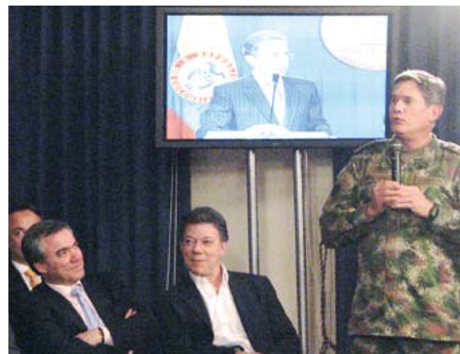
CASA DE NARIÑO, DOS DE JULIO DE 2008

Diálogo sostenido entre el Presidente y el Comandante General de las Fuerzas Militares. Casa de Nariño, dos de julio de 2008. 10:30 pm.