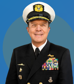
Armada de Colombia Almirante Francisco Hernando Cubides Granados