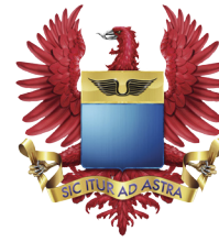
Fuerza Aérea Colombiana