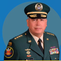
Comando General de las Fuerzas Militares General Helder Fernán Giraldo Bonilla