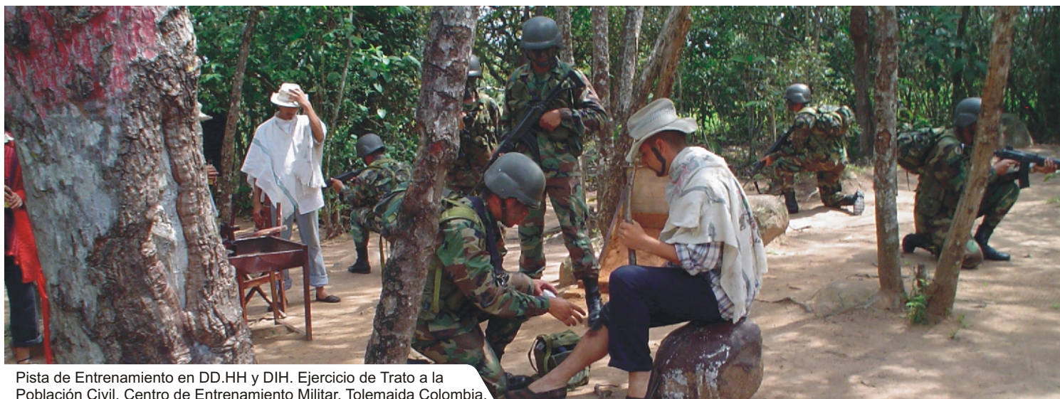
Pista de Entrenamiento en DD.HH y DIH. Ejercicio de Trato a la Población Civil. Centro de Entrenamiento Militar, Tolemaida Colombia.

En los años 2004 y 2005 respectivamente, se ha realizado una inversión de 1.500.000.000 millones de pesos (650.000 dólares aproximadamente), la cifra más alta que hasta la fecha se ha tenido en el