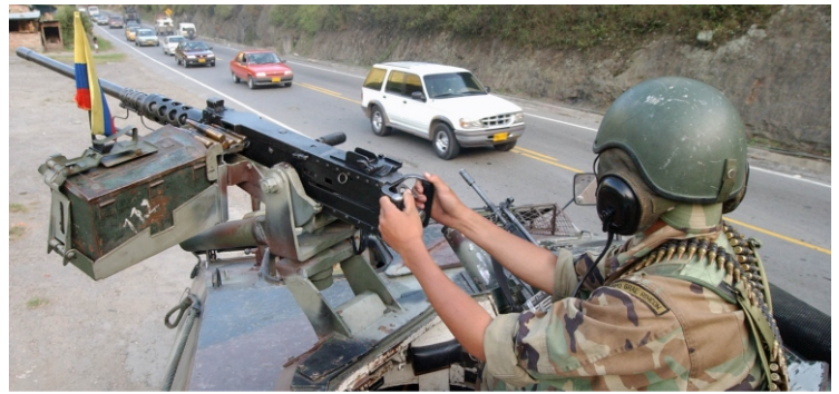
Plan retorno, el ejército vigila no sólo sobre las vías, sino desde los cerros el retorno de los viajeros en este puente festivo, el General Carlos Alberto Ospina, comandante del ejército, personalmente supervigila las operaciones de seguridad. Vía al Llano. Noviembre 11 de 2002.