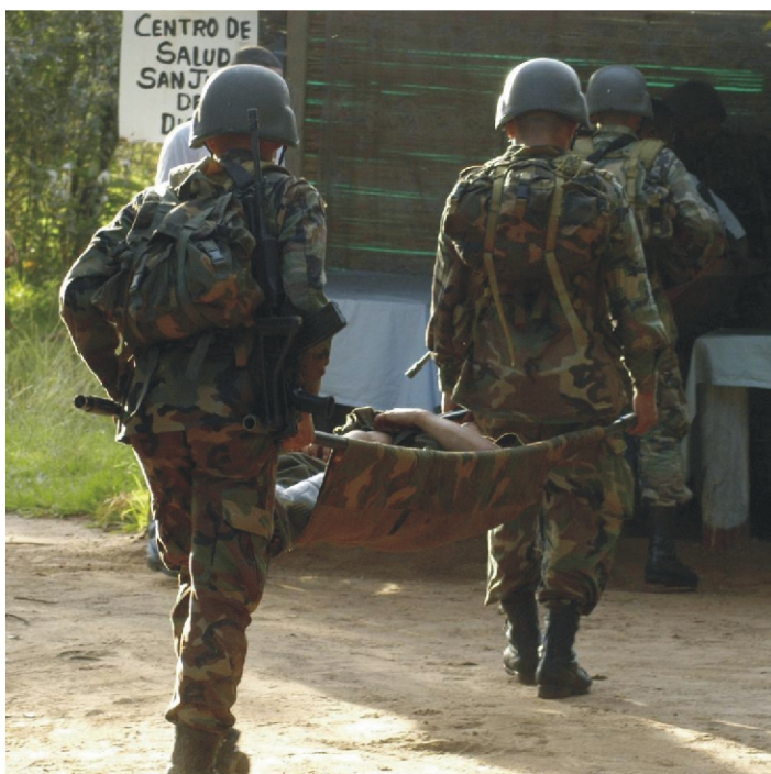
Pista de Entrenamiento en DD.HH y DIH. Ejercicio de Respeto al Enemigo Herido o que se Rinde. Centro de Entrenamiento Militar, Tolimaida Colombia.